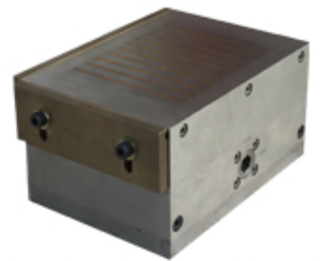
【スイッチ式着脱タイプ】